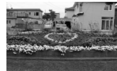
優秀賞(一般の部) 駒場南町内会くすみ公園