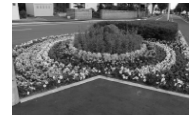
優秀賞(一般の部) 島松仲町町内会仲町花壇

毎年、町内会等が管理する公園花壇を審査する「花壇コンクール」も昨年で51回目を迎えました。年々レベルが上がり、訪れる方々に「花のまち恵庭」を印象づける素晴らしい取り組みを町内会が中心として行っています。