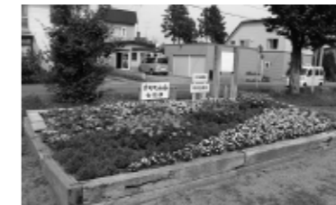
優秀賞(一般の部) 幸町町内会婦人部けいほく公園