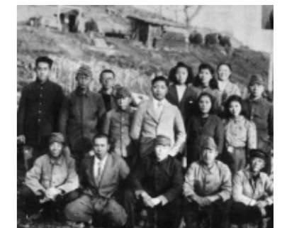
▲みどり野を去る人々