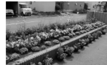
最優秀賞(学校の部) 恵み野小学校