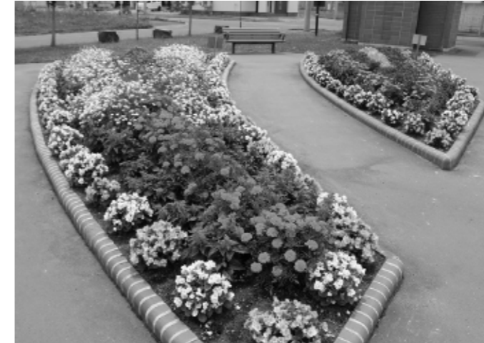
最優秀賞(一般の部) 黄金南曙ひまわり会やすらぎ公園